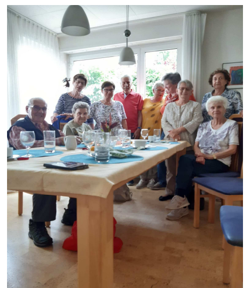
Bilder vom Gschwellti-Essen vom 14. Juli 2021